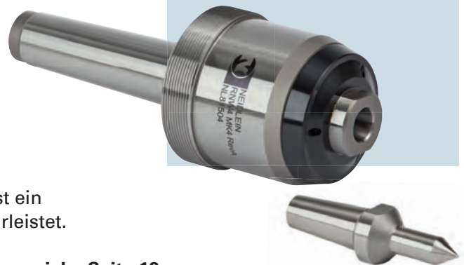
Typ RNW mit Morsekegel

Verschiedene Zentriereinsätze in verschiedenen Formen siehe Seite 13 Sondereinsätze nach Kundenwunsch lieferbar